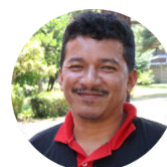
Scuola Cavanis del Congo (Maison d'Accueil Cavanis – MAC)