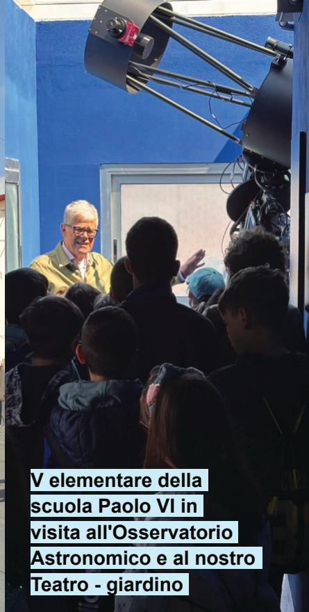
V elementare della scuola Paolo VI in visita all'Osservatorio Astronomico e al nostro Teatro - giardino