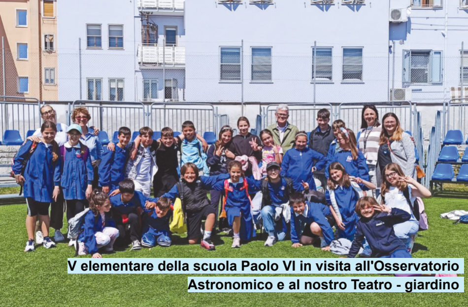
V elementare della scuola Paolo VI in visita all'Osservatorio Astronomico e al nostro Teatro - giardino