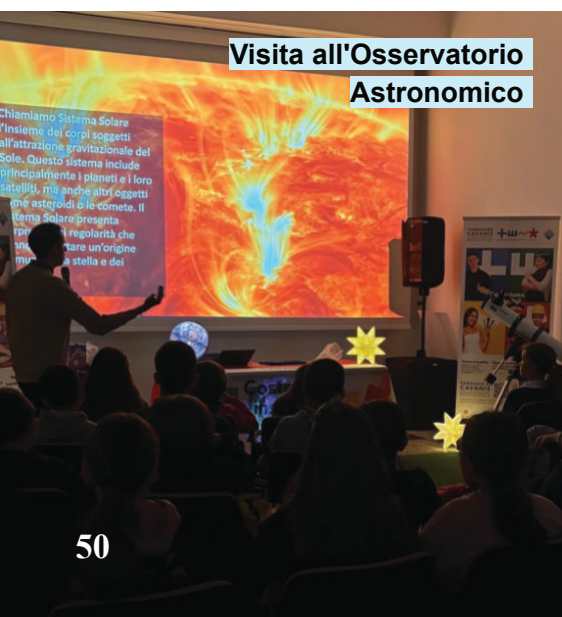
Visita all'Osservatorio Astronomico