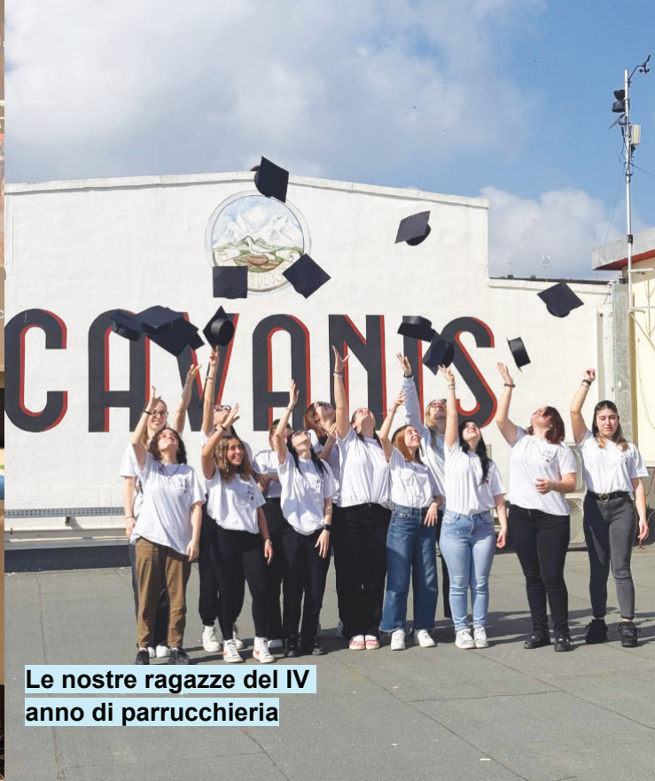
Le nostre ragazze del IV anno di parrucchieria