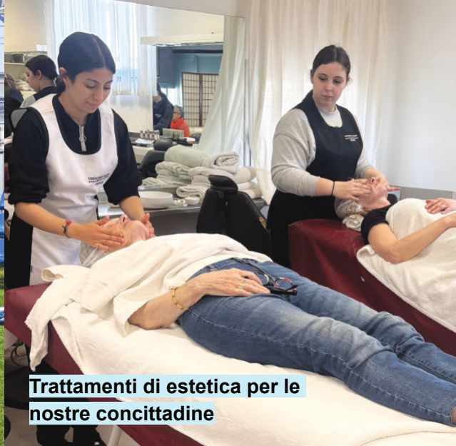
Trattamenti di estetica per le nostre concittadine